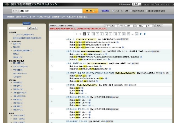
【キーワード「津軽 弘前」の検索結果】