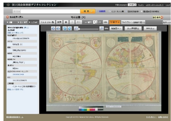
【絵図の表示イメージ】