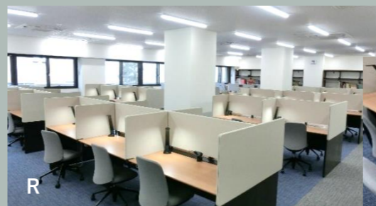
全席コンセント配備の快適空間