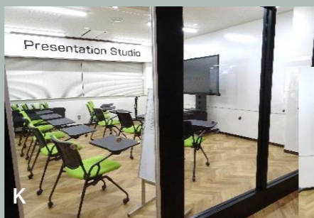
ビデオカメラや編集用 PC も貸出しています