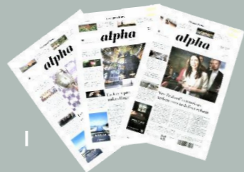
英字新聞や eBook などおすすめ